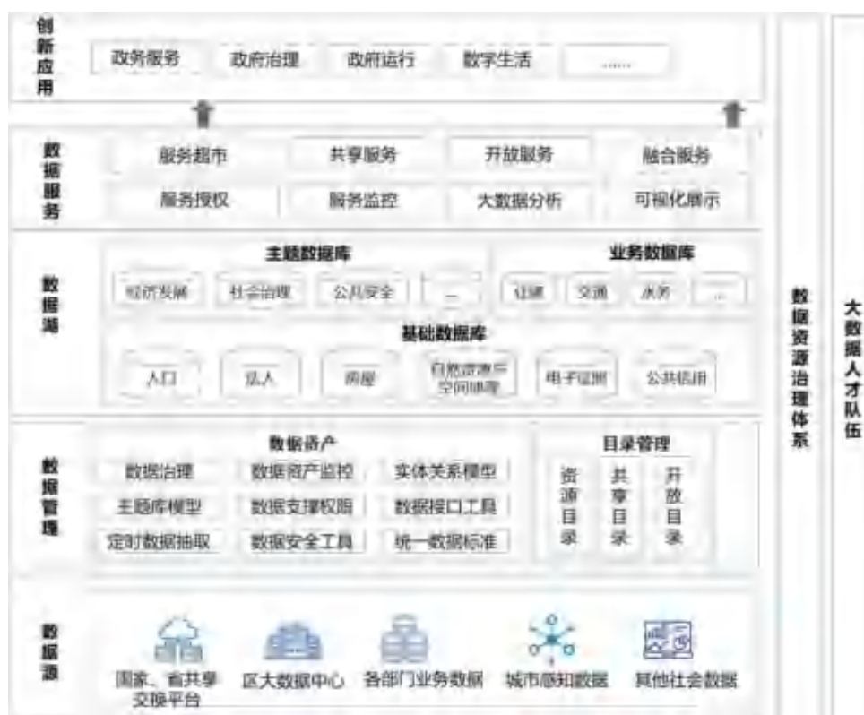
图 3 数据架构

数据源。 包括本市公共数据资源和社会数据资源，以及依托国家、省大数据中心数据共享交换获取的数据。