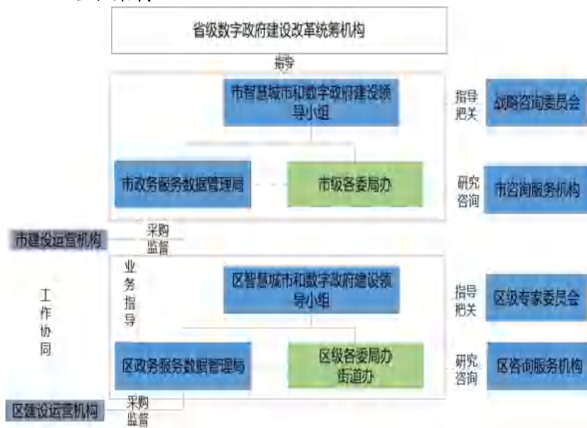
图 1 组织架构

统一领导。 市智慧城市和数字政府建设领导小组负责宏观指导、统筹规划、跨部门协调和工作部署，对相关重大事项进行决