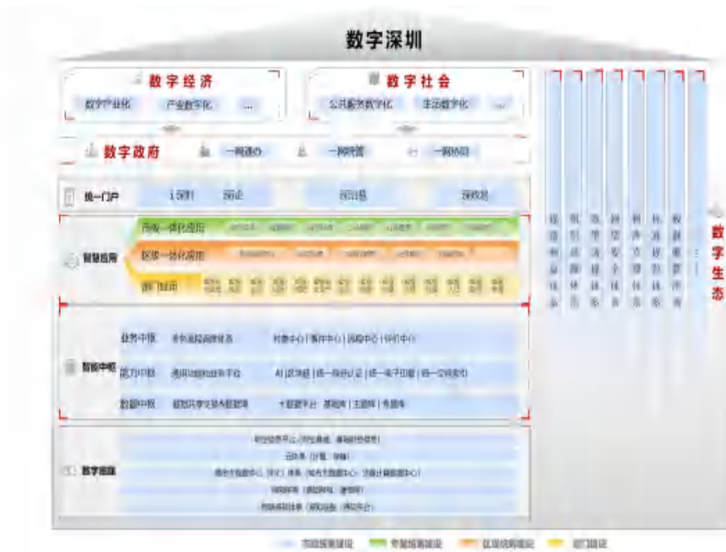
图 2 总体架构

数字底座。 统筹建设的全市一体化信息基础设施体系，为城市全要素数字化、城市运行实时可视化、城市管理决策协同化和智能化提供强有力支撑，并与省政务云、政务网、政务大数据中心全面实现互联互通。